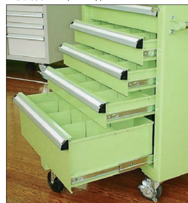
■使用例 Example of application